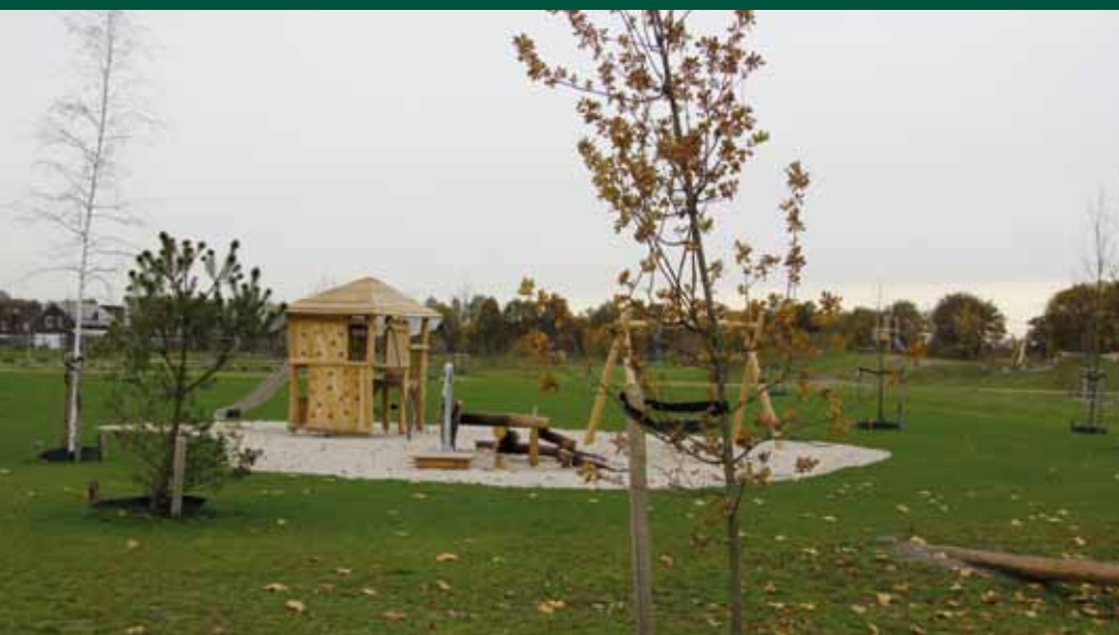
Natuurlijk spelen in het Zuiderpark

Menig passant die Uden doorkruist, van oost naar west en van noord naar zuid, zal het ongetwijfeld opvallen: het vele groen langs wegen en in de wijken. Gras, variërend van kortgeschoren tot lange wilde uitgroei, groene plantenborders en zeker ook de vele bomen in tal van soorten en ook grote maten. Ook voor het gemeentehuis stoere stevige platanen en even verderop op de Markt de dit jaar nieuw aangeplante trots van Uden: dorpslinde 't Prilleke.