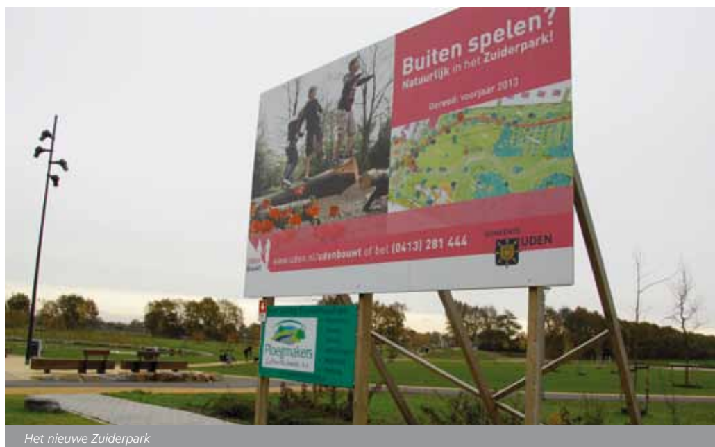
Het nieuwe Zuiderpark

Maar hoe voorkom je dat iedereen zijn zegje gaat doen en zijn wensen op tafel legt, uitdraaiend op oeverloze discussies? Delhez: 'Bij de aanleg van nieuwe groenvoorzieningen wordt een uitnodiging voor een eerste informatieavond aan de hele wijk verstuurd. Daaruit blijven meestal wel zo'n 15 tot 20 mensen over. Samen gaan we dan aan de slag. Dus met bewoners, direct aanwonenden, jeugd, gemeente, maar ook belangenverenigingen zoals IVN en gehandicapten en externen, zoals ook bij het ontwerp van het Bevrijdingspark is gebeurd.' Om het de inwoners zo gemakkelijk mogelijk te maken om in het groenbeheer te participeren, stelt de gemeente Uden aanhangers met tuingereedschap beschikbaar. 'Met advies