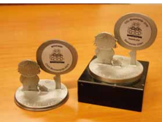
De CO 2 -Bomenprijzen voor Uden

een groot gedeelte afkomstig uit de eigen stadskwekerij. Ook zijn er veel fruitbomen en struiken aangeplant. Hierdoor willen we de betrokkenheid en het gebruik van het park vergroten.'