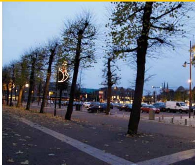
Leilinden aan de rand van de Udense markt