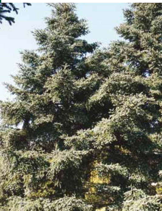
Abies pinsapo var. maroccana