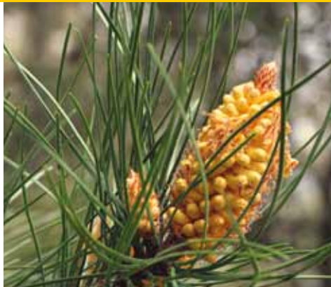
Pinus pinaster : mannelijke kegel