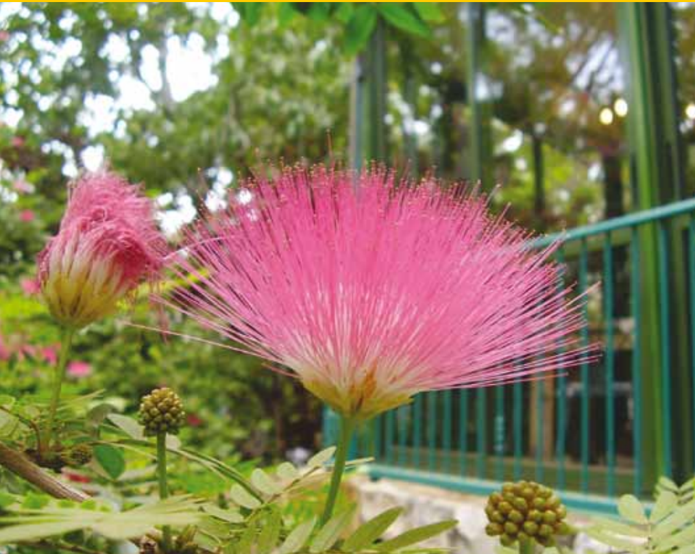
Albizzia-bloem, bestaande uit roze meeldraden