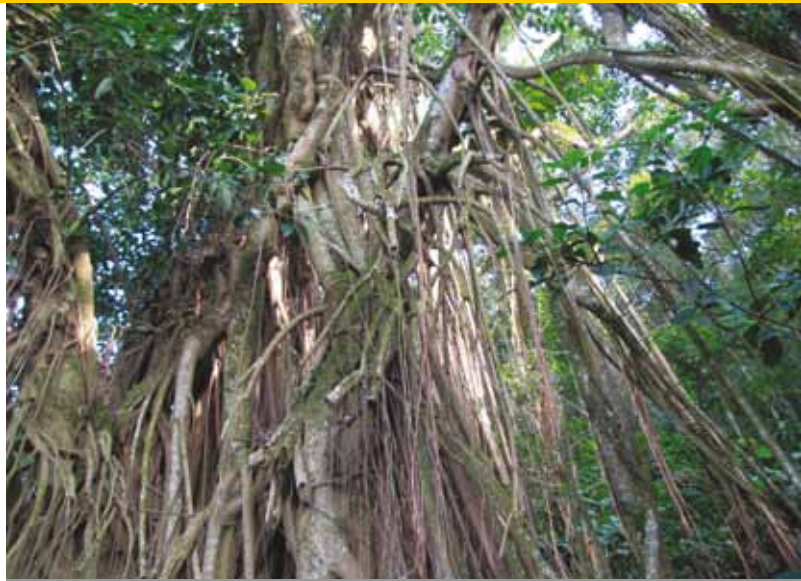
Ficus, stam met luchtwortels

met een dichtvertakte, brede, grillig ronde kroon op een korte ruw gegroefde stam. Bijzonder is dat de stam vrijwel nooit recht is en de boom ook meestal scheef staat of tegen een muur hangt. Oude exemplaren moeten vaak gestut worden om te overleven. Bijzonder en ook wel weer erg fraai. De jonge, groene twijgen zijn sterk behaard, de oudere twijgen juist kaal, en purperkleurig met ronde lenticellen en redelijk grote knoppen tot wel 1 cm lang en glanzend donker bruinrood. De bladeren zijn breed eivormig, zelden gelobd met een hartvormige bladvoet, handnervig tot in de grofgezaagde of zelfs dubbelgezaagde bladrand. Het bladoppervlak is enigszins ruw, in tegenstelling tot zijn witte, gladde broeder – qua blad dan. De bladkleur is aan de bovenzijde matglanzend donkergroen en lichtgroen aan de onderzijde, met een fraaie felgele herfstkleur. De bloemen van de zwarte zijn ook klein en niet echt bijzonder; de vruchten zijn wel 3 cm lang, aan een dubbel zo lange steel en via allerlei schakeringen tot roodzwart verkleurend. Deze grote vruchten zijn zoetzuur en heel smakelijk. Het geslacht Quercus is ook goed vertegenwoordigd in deze klimaatzone. Quercus behoort tot de onderfamilie van de Fagales , de Queroideae . Ik begin bij Gibraltar en ga dan oostwaarts richting Haifa in Israël.