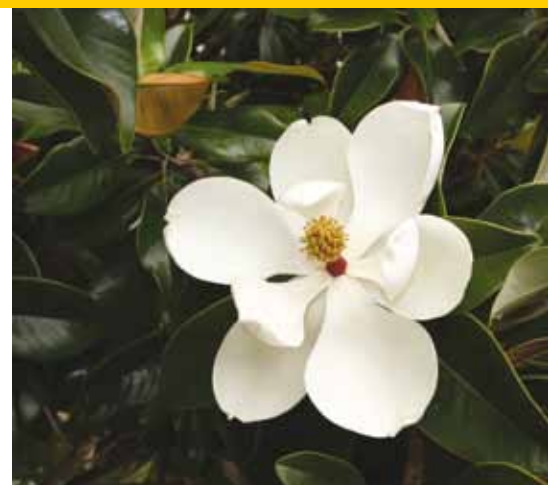
Magnolia grandiflora , bloem en blad

Moerbeïen behoren tot de familie van de Moraceae en komen al eeuwenlang voor in Zuid-Europa. De Morus alba komt van nature uit het Verre Oosten: China, Korea, het Himalaya-district en Taiwan. Morus alba is een tot maximaal 10 meter hoge boom met een brede eivormige, warig vertakte open kroon. Door een beroerd wortelgestel staan deze bomen vrijwel altijd scheef. De boom is door de eeuwen heen verspreid over de hele wereld en soms zelfs verwilderd. Voorbeelden hiervan zijn zichtbaar in Japan, aan de oostkust van de VS, in Centraal-Afrika en vooral in Zuidoost-Europa. Een hard gegeven is dat de boom in 1596 in Engeland is ingevoerd. De boom is in China, maar ook in Zuid-Frankrijk, hofleverancier voor de zijderupsencultuur. Het blad is meestal breed eirond, met 1 tot 3 onre-