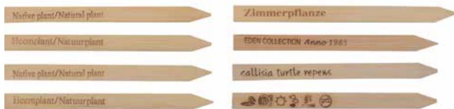
De Ekostekers worden door middel van laser bedrukt.