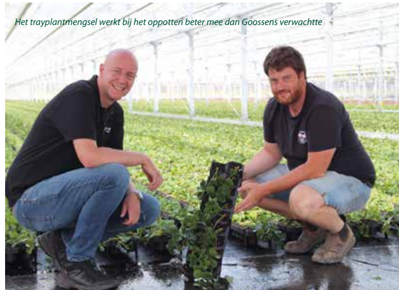
Het trayplantmengsel werkt bij het oppotten beter mee dan Goossens verwachtte