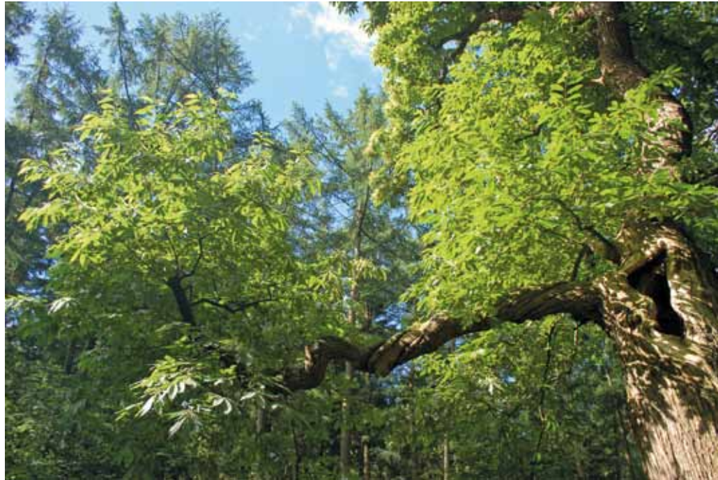
De gesteltakken van deze joekels zijn al bomen op zich.

De drie tamme kastanjes kunnen volgens Spijker nog honderden jaren mee. 'Het is eigenlijk een mooi systeem dat een boom als hij ouder wordt, aangetast wordt en hol. Daardoor blijft hij langer staan en breekt er hooguit hier en daar een tak uit. Als de boom massief zou blijven en zou doorgroeien, zou hij eerder in zijn geheel omvallen. Het is wel belangrijk dat de drie tamme kastanjes worden begeleid in hun aftakelingsfase. Ik zou aanraden om de groeiplaatsen af te zetten, zodat ze niet meer betreden kunnen worden, en de