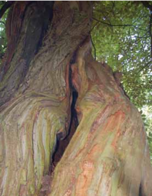
'De gedraaide bast vind ik prachtig', aldus Spijker.