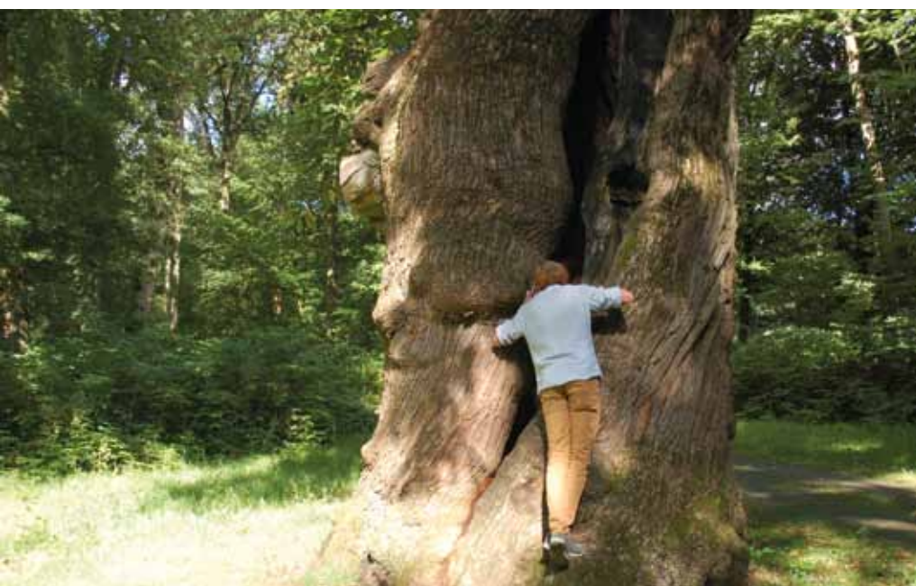
De tamme kastanjes zijn in goede conditie ondanks alle holtes en spleten.

www.Boom in Business.nl/artikel.asp?id=23-6888