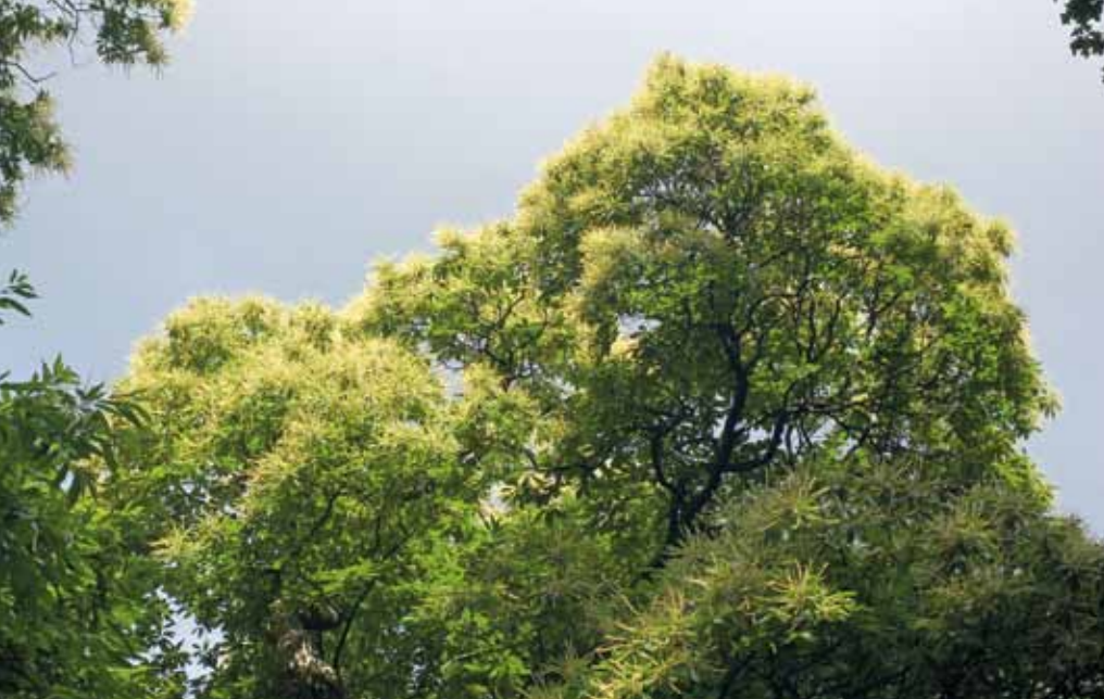
Witte bloemetjes stralen in de zon.