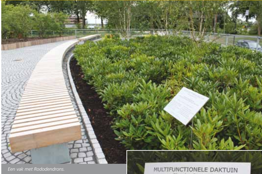
Een vak met Rododendrons.

De wuivende halmen op de gevels hebben in de buitenlucht nu een vervolg gekregen in de daktuin. Alle hier aangeplante bomen, planten en struiken zijn gratis geleverd door bij de ZLTO aangesloten boom- en plantenkwekers. Het groene ontwerp bestaat onder meer uit verschillende plantvakken die van voor naar achteren in hoogte oplopende beplantingsniveaus bevatten. Door de verhoogde bakken - met daarin onder meer grassen, lavendel, meerstammige krentenbomen en rododendrons - zijn op het dak van de parkeergarage uiteindelijk drie verblijfsruimtes gecreëerd. Een groot terras om te lunchen, een vak - voorzien van elektriciteitsaansluitingen en draadloos internet - om in de buitenlucht te kunnen werken, en de laatste ruimte achteraan bevat zowaar een overdekte vergaderplek in de vorm van een gemoderniseerde hooimijt. De groepslocatie is voorzien van compleet uitschuifbare glaswanden