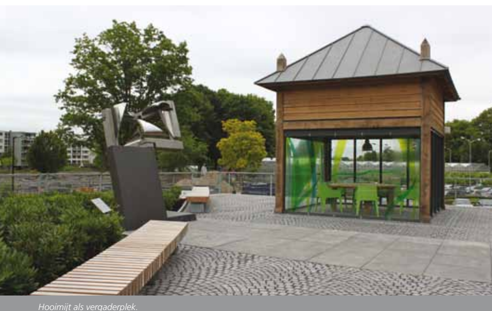
Hooimijt als vergaderplek.

Nu de daktuin begin maart is opgeleverd,