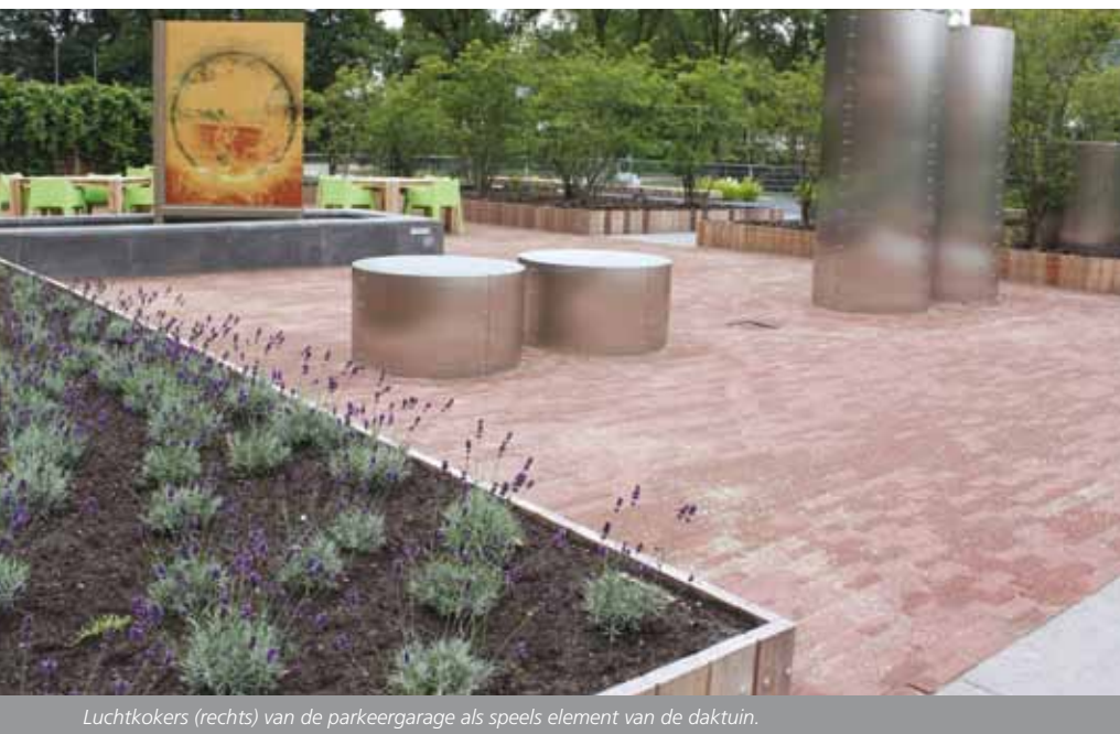
Luchtkokers (rechts) van de parkeergarage als speels element van de daktuin.