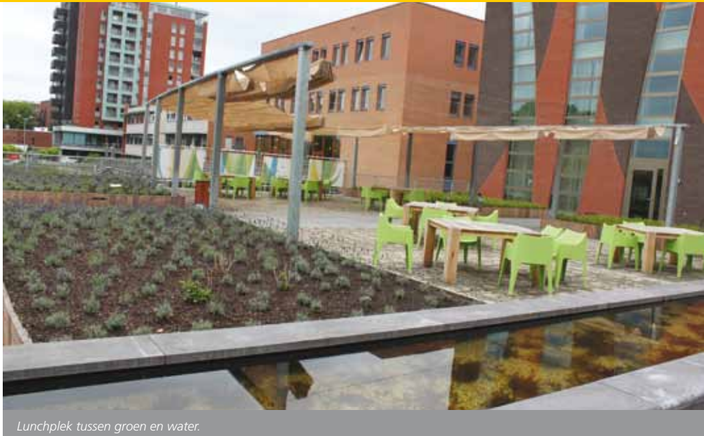
Lunchplek tussen groen en water.

komt ook het onderhoud om de hoek kijken. Van Doren: "Deze tuin is redelijk onderhoudsvriendelijk. Wij hebben bij het ontwerp meteen ook een beheerplan opgesteld." Zou het onderhoud in beginsel door studenten van de Helicon worden opgepakt, momenteel is deze klus toch in handen van een professioneel hoveniersbedrijf. "In principe was het inderdaad de bedoeling dat studenten van Helicon hier praktischles zouden krijgen en tevens het onderhoud zouden doen. In de praktijk bleek dit toch niet te werken." Ondanks deze minder positieve ervaring wordt na de zomervakantie toch opnieuw beken of en hoe studenten