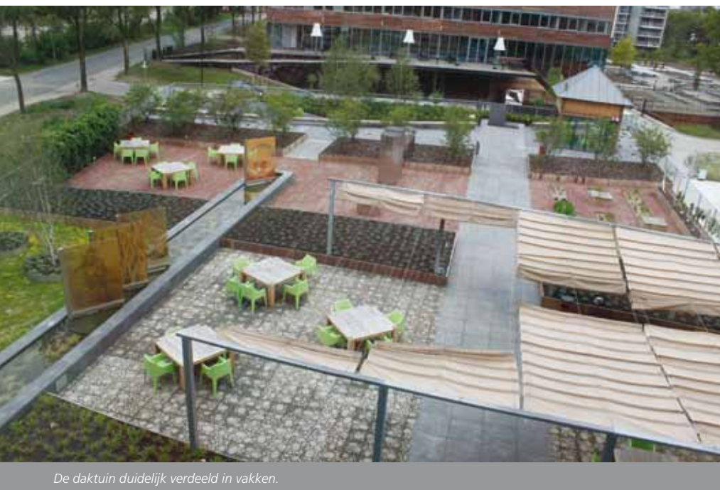
De daktuin duidelijk verdeeld in vakken.

Doordat de bouw al in een vergevorderd stadium was op het moment dat de HAS-studenten met het ontwerp van de daktuin aan de slag gingen, moesten zij creatief omgaan met de bestaande harde gegevens. Zo kon de daktuin door de