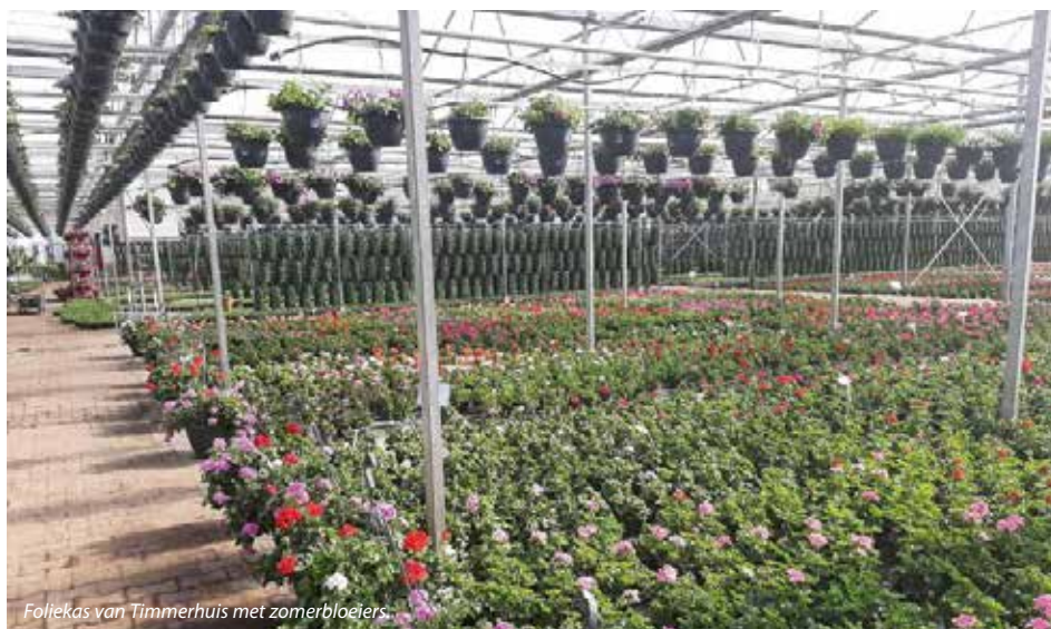
Foliekas van Timmerhuis met zomerbloeiers.

In het Twentse Denekamp gaan we op bezoek bij Kwekerij Timmerhuis. Theo Timmerhuis houdt zich daar al ruim vijftien jaar bezig met het kweken van perkgoed. Financieel blijkt perkgoed interessanter voor hem te zijn dan snijbloemen. Wandhangers en hangpotten doen het momenteel goed bij Kwekerij Timmerhuis. ‘Van belang is bij perkgoed dat je goed kunt ventileren,’ legt Timmerhuis uit. ‘Het is minstens zo belangrijk dat je werkt met folie om de hevigste zonnestrallen tegen te houden.’ Timmerhuis werkt momenteel nog met twee kassen en heeft voor de derde keer een tweedehands foliekas (type VDH) gekocht op advies van Van der Heide Agro. ‘Een kas van 4,80 meter breed en 3,50 meter hoog