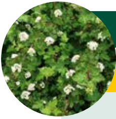
P. capitatus 'Tilden Park'

Bloeitijd KW 22-25 bloeilengte: 3 W sierwaarde bloei: middelmatig kleur: wit vrucht: bruin zaadzetting: gering - matig