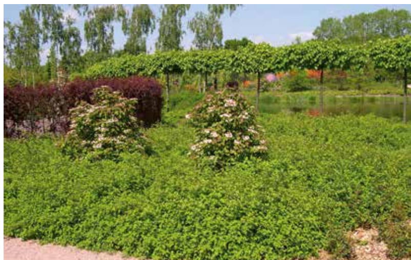
Physocarpus capitatus 'Tilden Park' als bodembedekker