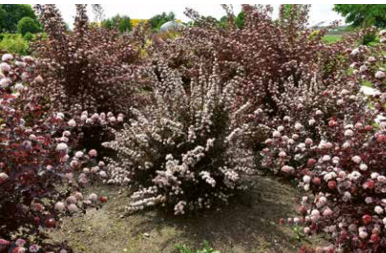
Physocarpus opulifolius , hier 'SMPOTW' (TINY WINE), midden op de foto. In volle bloei is het een lust voor het oog.