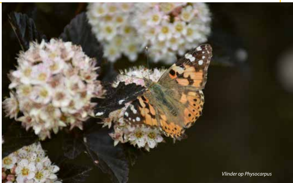
Vlinder op Physocarpus

Overzicht van de evaluatie van het Physocarpus -assortiment, getest als onderdeel van de Euro Trials op afzonderlijke Europese locaties. Hierbij staat *** voor uitstekend, ** voor zeer goed, * voor goed, s voor variëteit voor speciale doeleinden en 0 voor vervangbare variëteit.