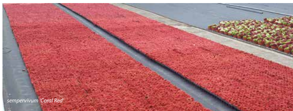
Sempervivum 'Coral Red'