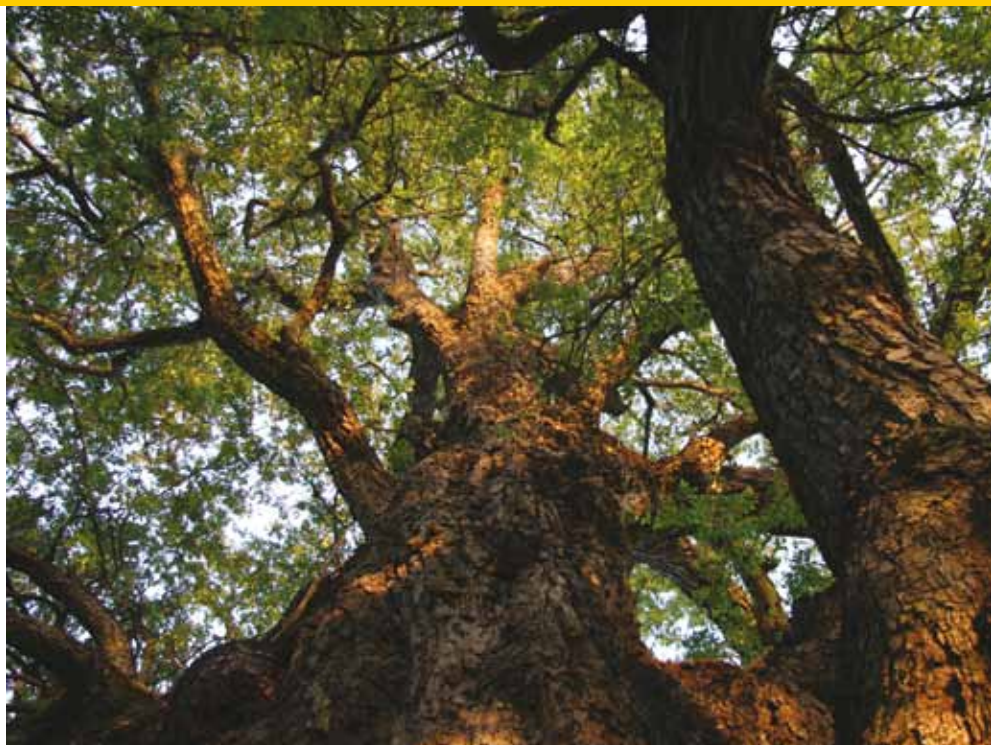
Stam en kroon.

in dit gebied voorkomende, Nothofagus obliqua . De bomen worden daar tussen de 20 en 25 meter hoog. Deze schijnbeuk wordt ook hoog gewaardeerd om het waardevolle hout, dat ook wel Chileens mahonie wordt genoemd. Gewone stervelingen denken dan 'Mahonie, dat is toch dat roodachtige hout van Billy, een Ikea boekenkast. En dat hout komt dus uit Chili'