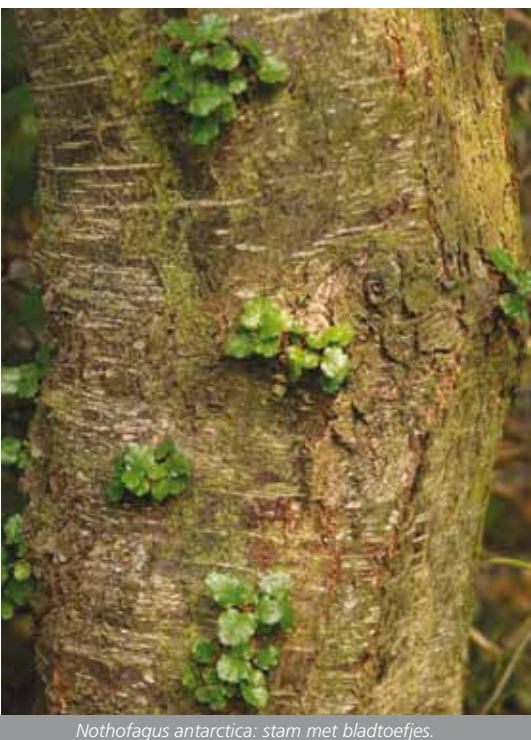
Nothofagus antarctica: stam met bladtoefjes.

Sectie Fuscospora met o.a. Nothofagus truncata , die voornamelijk in Nieuw-Zeeland te vinden zijn.