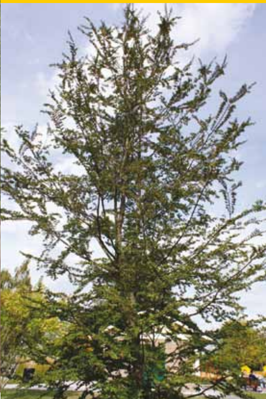
Nothofagus antarctica zomerbeeld.

Zeeland voor met o.a. Nothofagus nervosa en Nothofagus obliqua .