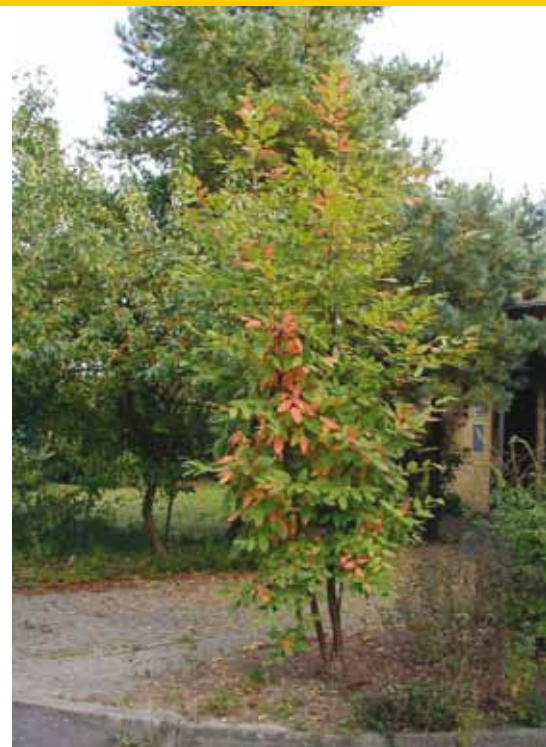
Nothofagus nervosa jonge boom met herfstkleur.

veroorzaakt door de warme Golfstroom, is daar in belangrijke mate debet aan. In tegenstelling tot Nederland en andere Europese landen, bereiken de bomen daar toch respectabele hoogten van boven de 15-18 meter hoogte. Verder is het bijzonder te vermelden dat de meeste schijnbeuken snelle groeiers zijn, met name in de jeugd-fase, en dat ze, onder gunstige omstandigheden, bovengronds sneller ontwikkelen dan de ontwikkeling van het wortelgestel. Bijzonder, maar ook kwetsbaar. Door een achterlopende wortelontwikkeling zijn de bomen daardoor nogal windgevoelig en staan ze vaak een beetje scheef. Verder zijn de bomen gevoelig voor zware en met name late nachtvorsten. Dit laatste wordt gelukkig wel weer snel teniet gedaan door het enorm herstellend vermogen van de bomen om de geleden schade weer snel te overgroeien.