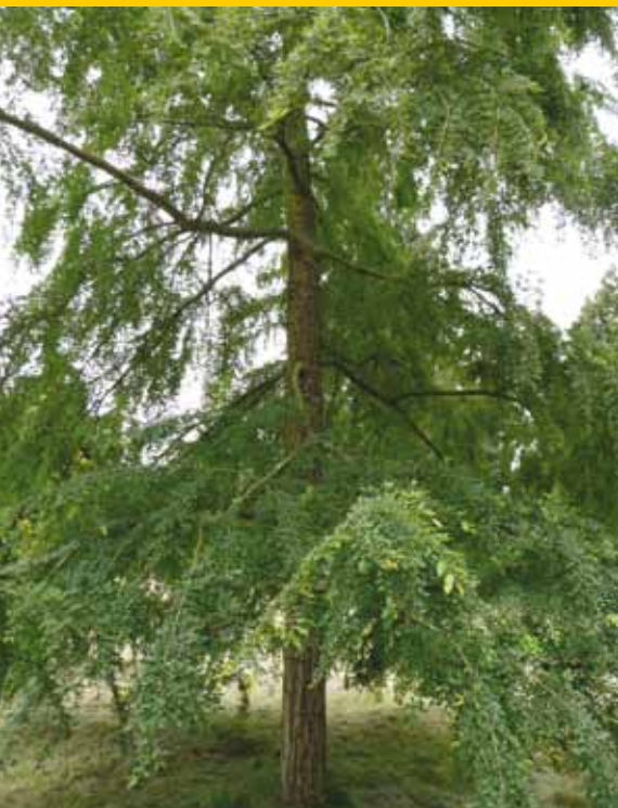
Nothofagus obliqua : algeheel beeld.