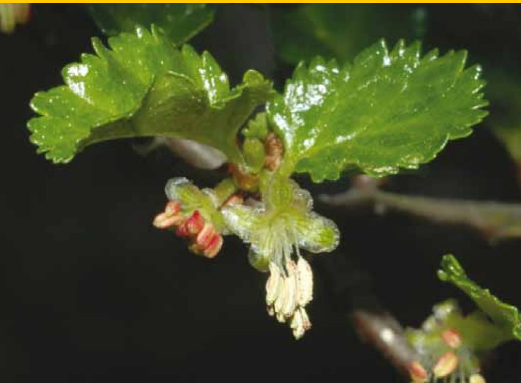
Blad en bloeiwijze.